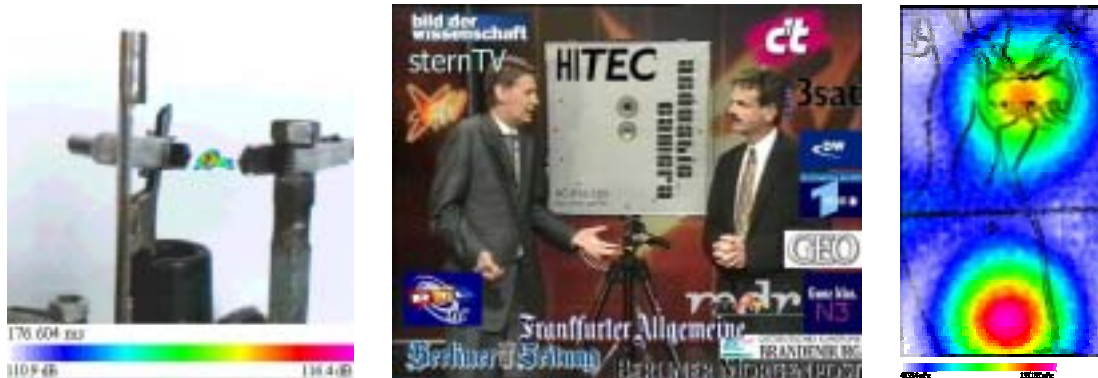
Bild 3: links akustisches Bild eines elektrischen Funkens; mittig Medienrummel mit Günther Jauch, sternTV/RTL; rechts eine Schallreflexion kann auf einer Tischplatte sichtbar gemacht werden